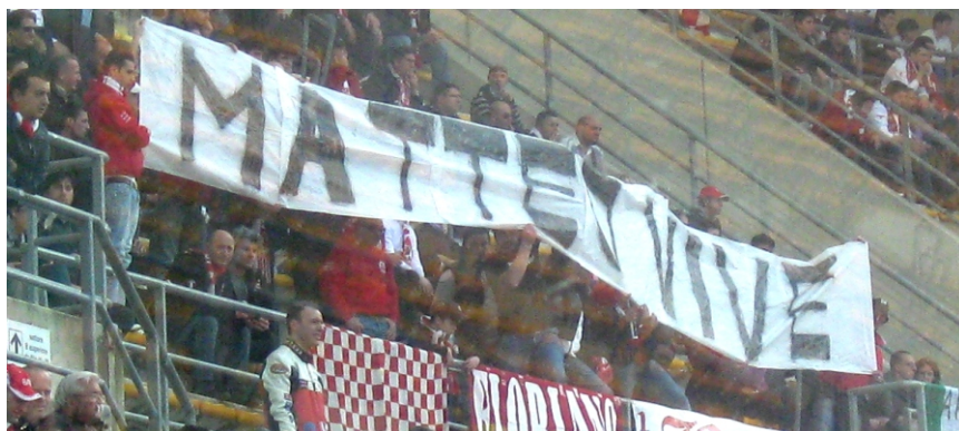
BARI-PARMA 09/10 LO STRISCIONE ESPOSTO IN CURVA SUD DA VIKING