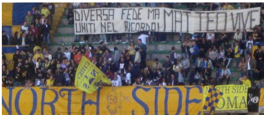
CHIEVO-PARMA 09/10 I NORTH SIDE SI UNISCONO AL RICORDO DEL BAGNA